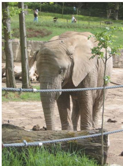
Zoologická zahrada se spoustou atraktivních zvířat jistě stojí za návštěvu.

■ Větrný mlýn ve Štípe / Větrný mlýn holandského typu, který byl postaven v letech 1858–1860 asi 500 m jihovýchodně od obce Štípa. Od roku 1964 kulturní památkou. Přístupný veřejnosti je v době od dubna do října po domluvě s majiteli v domě čp. 130.