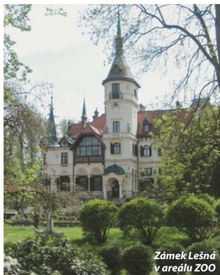
Zámek Lešná v areálu ZOO